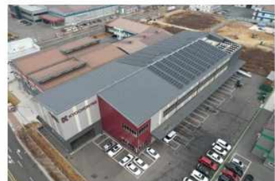
[김해시 전례면 교*]