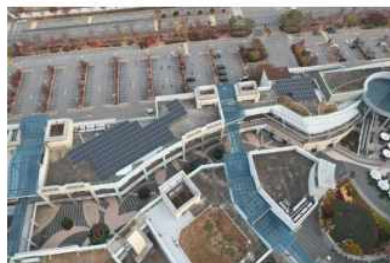
[김해시 신문동 롯데*]